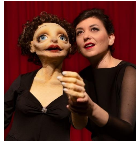
Edith and me.