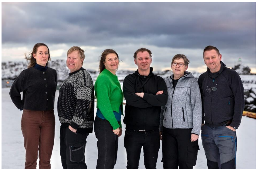
Figurteatrets stab.

Formålet til FiN er å utvikle figur- og visuelt teater som kunstnerisk genre i Norge. Dette gjøres gjennom å tilby kunstnere og kompanier fra hele verden, gunstige produksjonsvilkår, det vil si samproduksjon, turne, forprosjekter, sommerresidens, kurs & workshops og hospitantplasser. Like viktig er FiNs publikumsrettede virksomhet. FiN tilbyr produksjoner for barn, unge og voksne. Fokusområder for FiNs virksomhet er profesjonalitet, høy kvalitet og