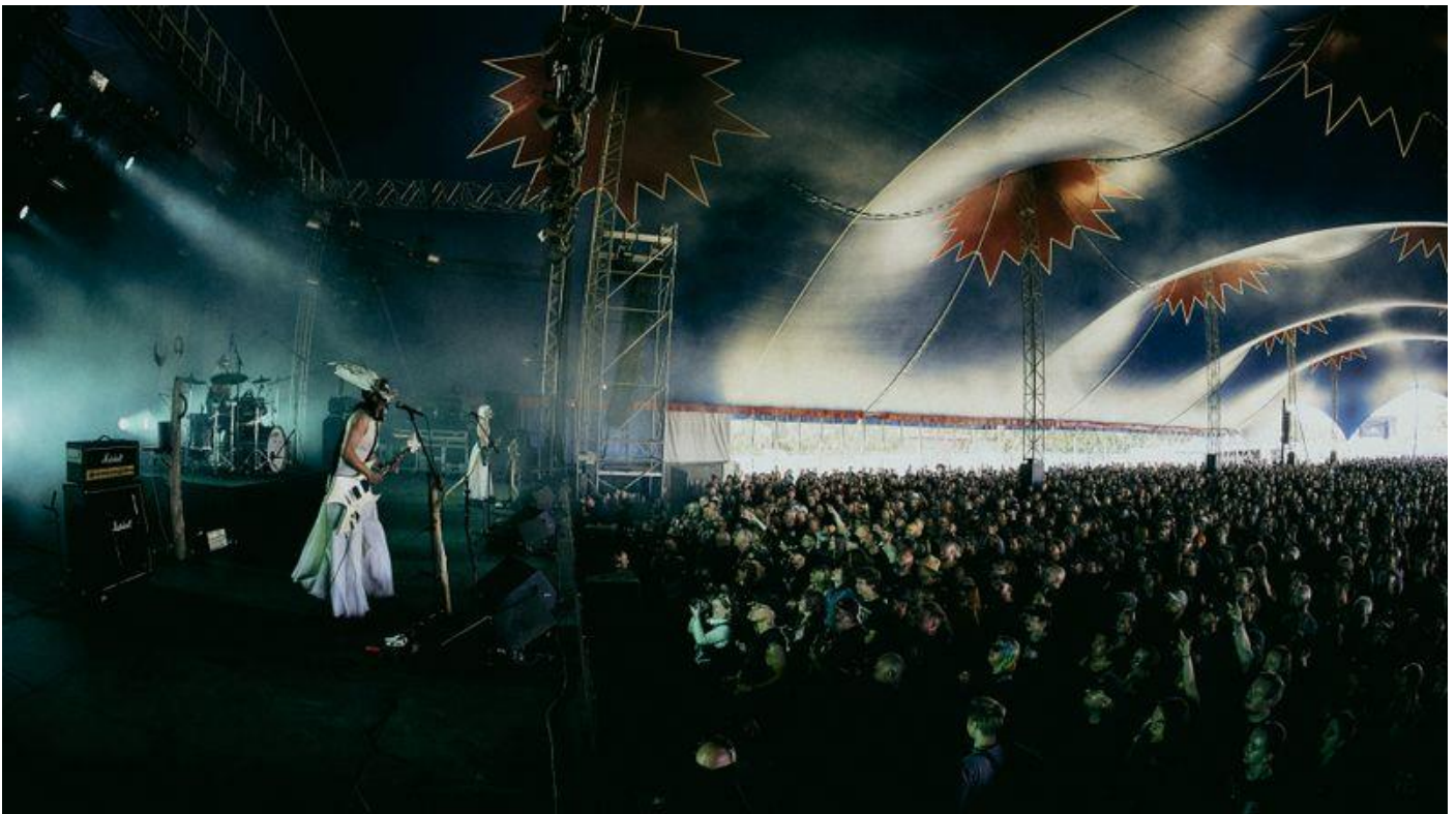
Fra Witch Club Satans konsert på Tons of Rock.

Under «verdens viktigste kunstfestival», Avignonfestivalen i Frankrike, i juli var FiN sterkt representert. Den norske paviljongen var kuratert av FiNs kunstneriske leder Yngvild Aspeli. FiNs samproduksjoner «Deja» av norsk-franske The Krumple og «Witch Club Satan» av det Andøybaserte kompaniet Lost and Found Productions var del av programmet. Det svært omtalte svartmetall-konsert-scenekunstprosjektet «Witch Club Satan» turnerte Europa og spilte blant annet for tusenvis av mennesker på Tons of Rock i Oslo og Roskildefestivalen i Danmark.