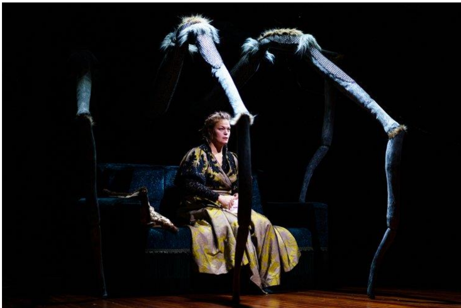
A Dolls house - Plexus Polaire og Figurteatret i Nordland.

I desember var FiN vertskap for forprosjekt med den tyske gruppa Florschutz og Döhnert, med produksjon av barneforestillingen «Between night and day». De spilte også gjestespillet «Rawums» for barn for 2 år og opp. Gruppen utforsker hvordan spill med enkle grep; objekter, lyd og bevisst bruk av lys kan formidle stemninger. Forestillingen har premiere på Scaubühne i Berlin våren 2024.