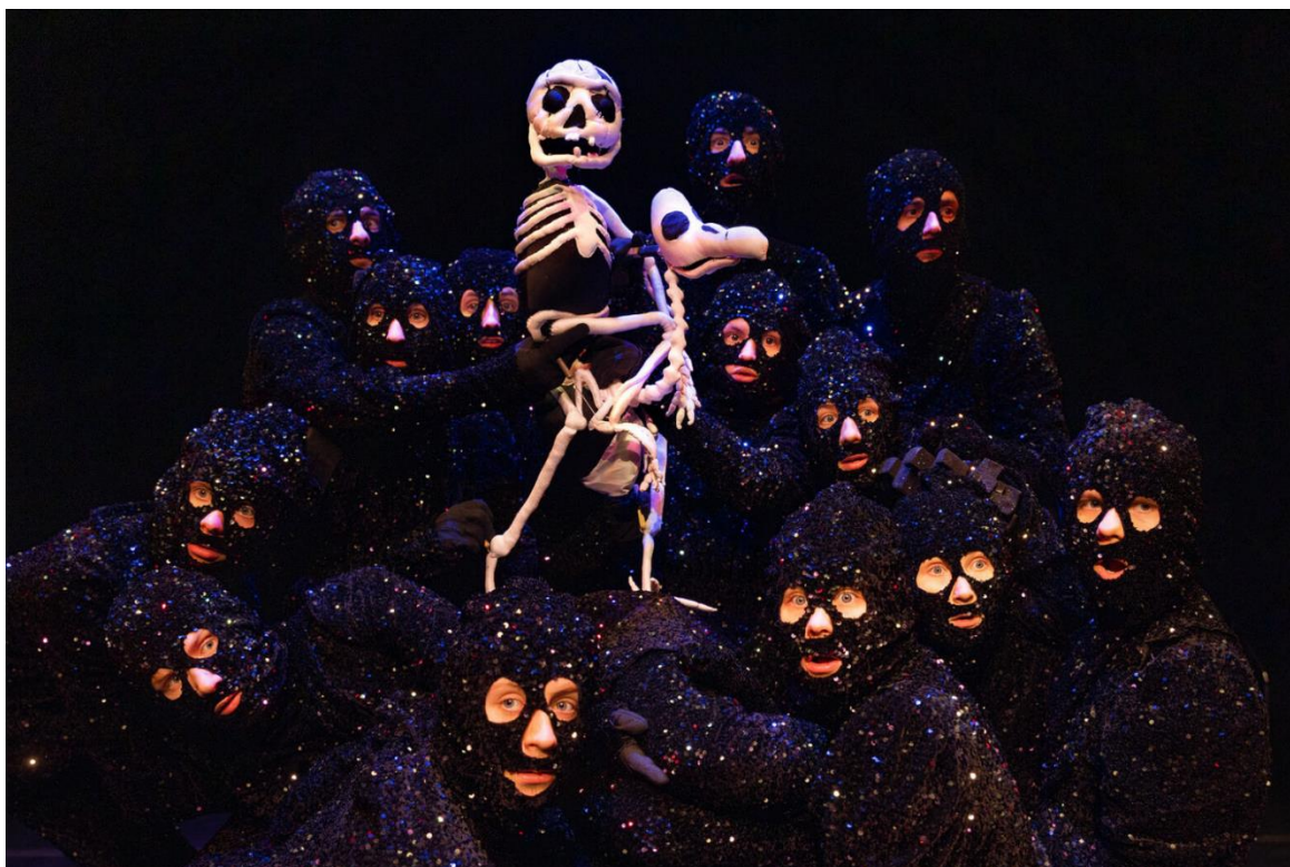
Dead as a Dodo - Wakka Wakka og Figurteatret i Nordland.