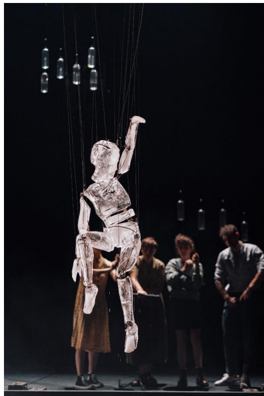
Les Vagues - Theatre L`Entrouverte og Figurteatret i Nordland