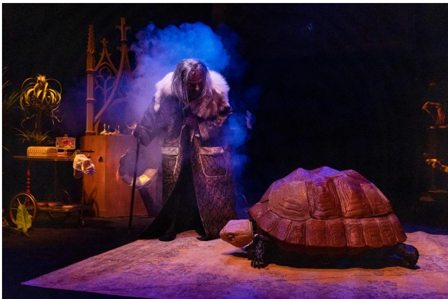
Compagnie Yokai - Nature Morte.