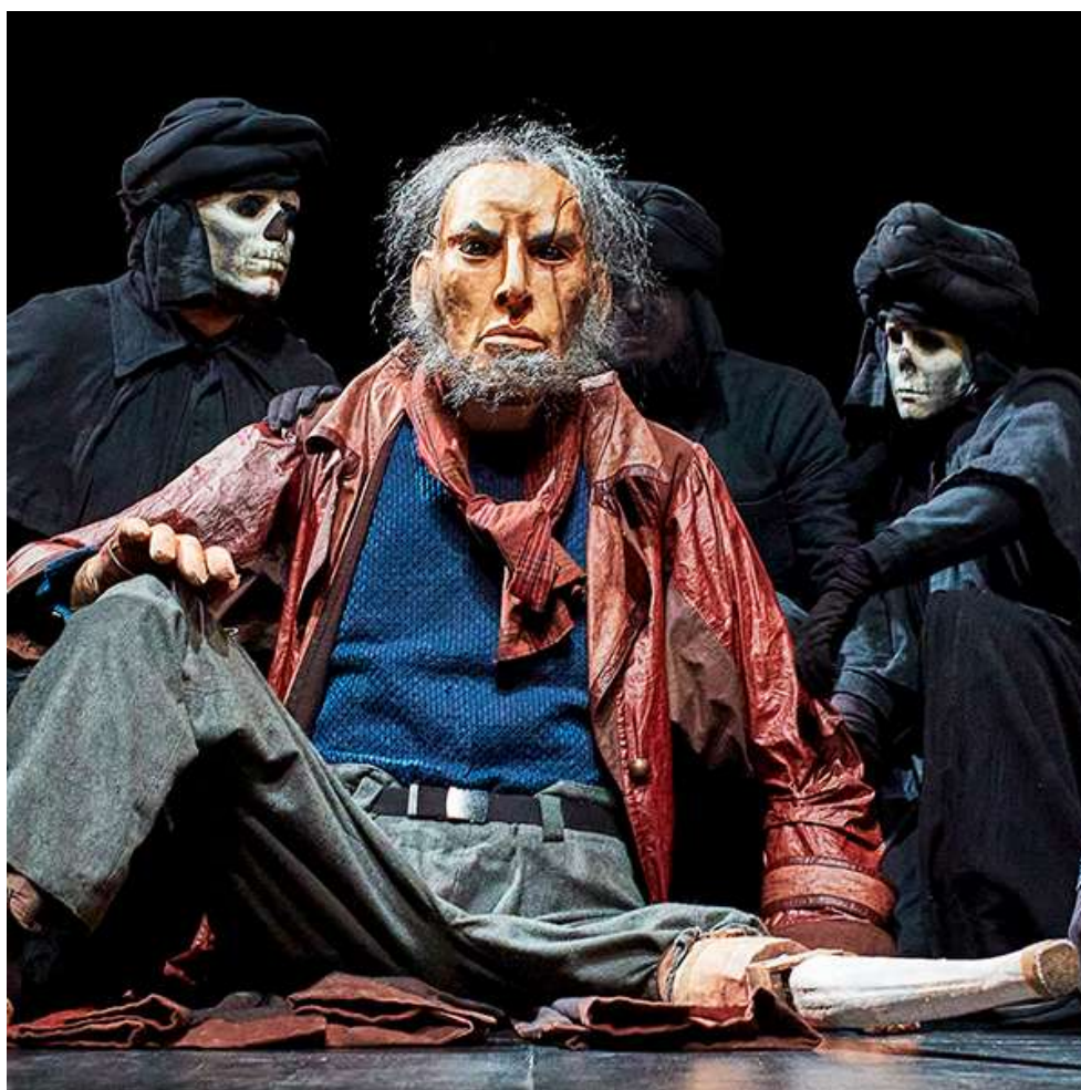
Moby Dick av Plexus Polaire spilte fem utsolgte hus på Barbican Theatre i London under festivalen MimeLondon.