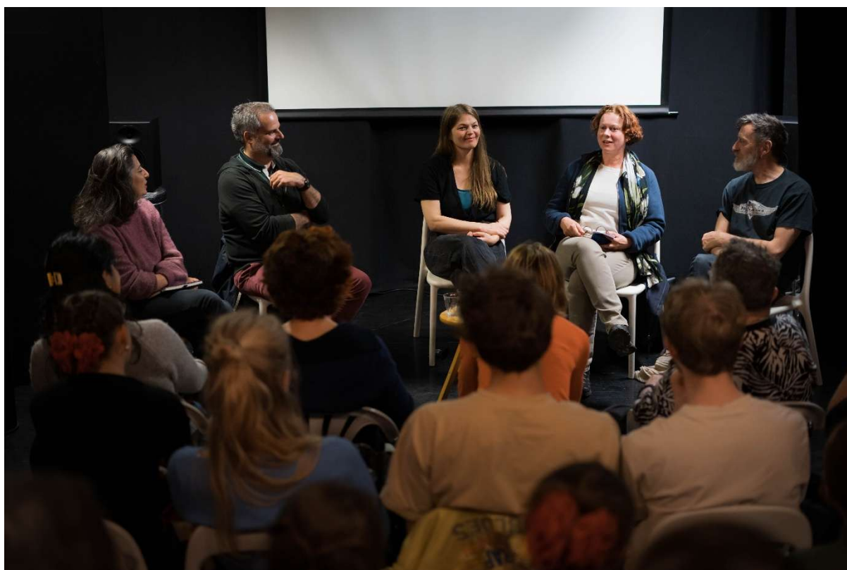
Panelsamtale på Figurteatret, under teaterfestivalen.

Iranske Roshanak Roshan viste sin film og utstilling Noon–The Bread of Tehran. Og det ble gjennomført kunstnermøter og pitch-sessions, i FiNs festivalcafe. Hele ni sentrale internasjonale teater- og festivalsjefer tok turen til SIT som FiN-inviterede gjester. Blant annet Lanxing Fu fra HERE Arts center (USA), Katja Spiess fra Imaginale Festival (Tyskland) og Ludovic Rogeau fra Le Bateau Feu, scène nationale de Dunkerque.