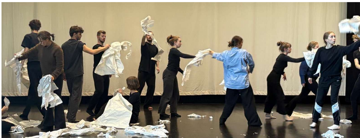
Workshop i Levanger i samarbeid med skuespillerutdanningen ved Universitetet i Nord