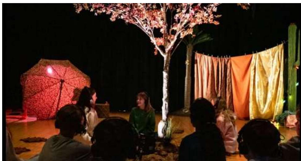
Frida av Katma turnerte for Riksteatret i 2025.

«Figurteatret distribuerer forestillinger i Nordland over eget budsjett og i samarbeid med DKS, kulturhus og teatre. FiN turnerer også i Troms og Finnmark og andre deler av landet. FiN bidrar også til promotering for enkelte produksjoner på strategisk viktige arenaer/festivaler i inn- og utland. Målsetningen oppgis i den årlige søknaden til kulturdirektoratet og ligger normalt på 100-120 forestillinger og 10 000 publikum over eget budsjett.»