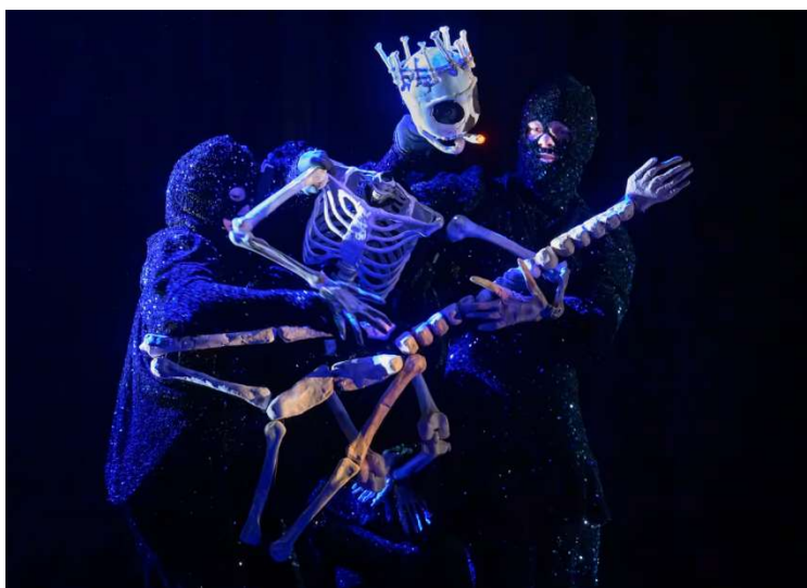
Dead as a Dodo, av Wakka Wakka. Tre av FiNs samproduksjoner med Wakka Wakka ble spilt for 22.000 mennesker i Europa, USA og Asia i 2025.