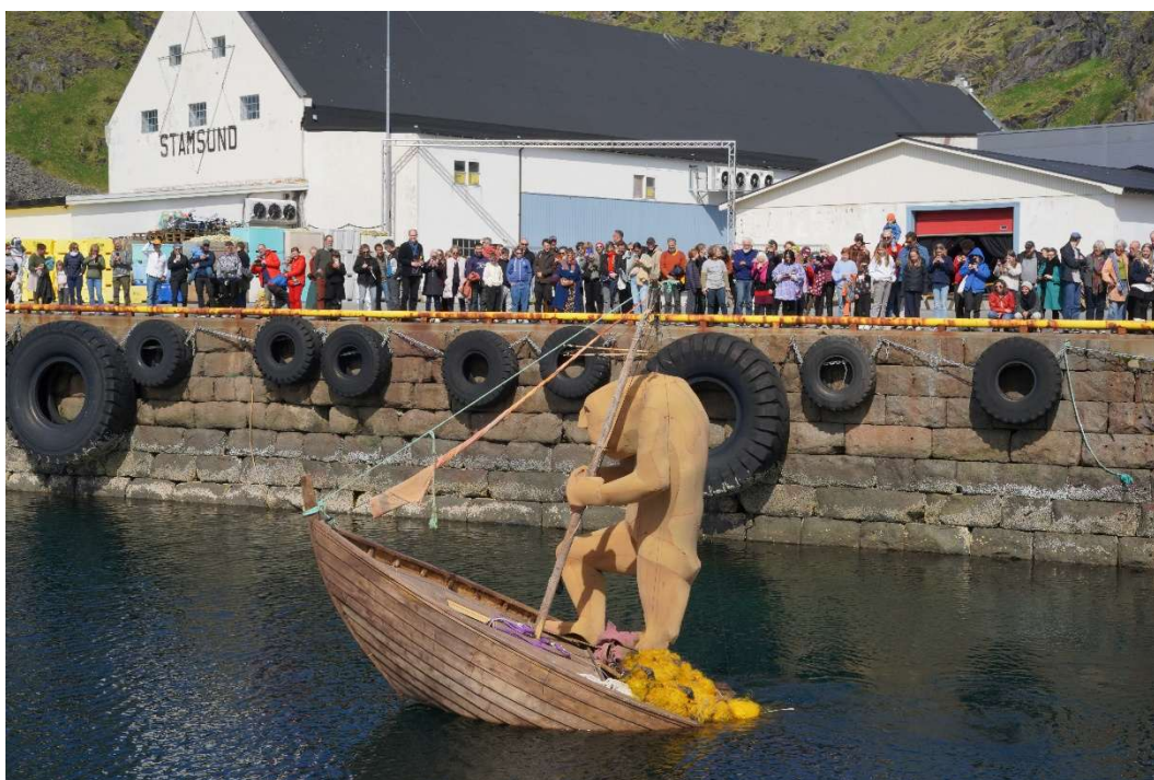
Draugen forlater Stamsund nok en gang.

Nytt bygg var planlagt finansiert av NFK i samarbeid med Vestvågøy kommune og KUD. I tråd med vedtak i Fylkesråd+ting søkte NFK om tilskudd til Nasjonale Kulturbygg i 2023 og 2024. Søknaden for 2025 ble ikke levert fordi Fylkesrådet ikke har funnet midler til egenfinansiering. Fylkesrådet har derfor tatt en fot i bakken og ser nå på andre alternative løsninger for lokaler.