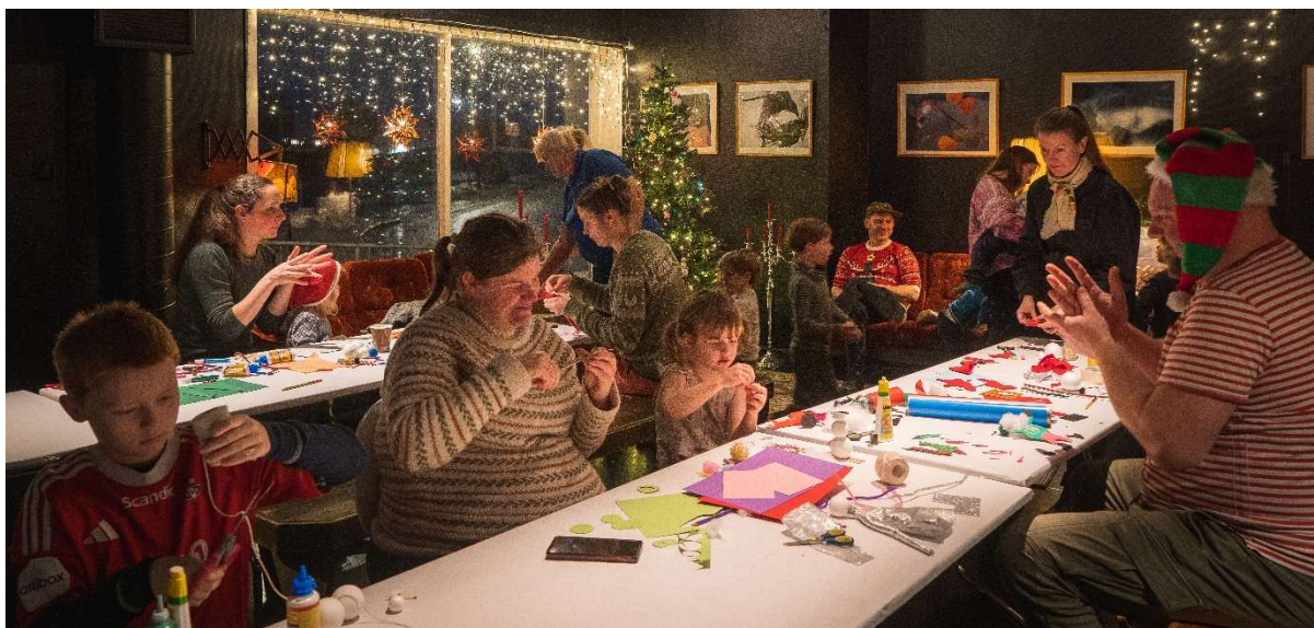
Figurteatrets juleverksted.

Alle FiNs ansatte gjennomførte helsekontroller, oppfriskningskurs for hjertestarter og førstehjelp. FiN følger NFKs rutiner for mangfoldsarbeid og ble i 2024 Balansemerket. Balansemerket er en sertifisering av kunst- og kulturvirksomheter som fremmer arbeidet for et tryggere og mer inkluderende arbeidsmiljø; og motvirker diskriminering og seksuell trakassering i kulturlivet.