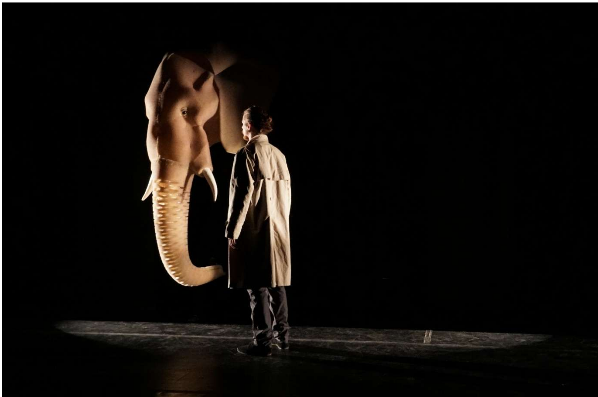
Ascencion av Sitio.

På FiN ble det i tillegg gjennomført en rekke visninger der både produksjoner og forprosjekter fikk testet seg gjennom åpne visninger for publikum.